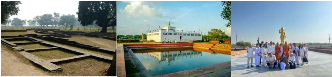
อาหาร: เช้า / กลางวัน / เย็น ที่พัก: วัดไทยลุมพินี / Bhairahawa หรือเทียบเท่า