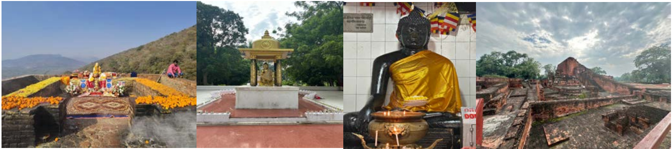
อาหาร: เช้า / กลางวัน / เย็น